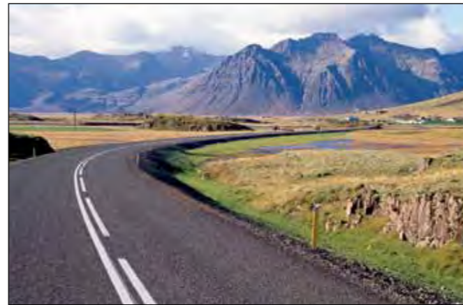
Hringvegur (1) í Suðursveit, stofnvegur.