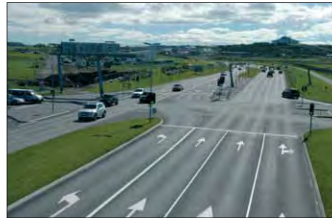
Nesbraut (49) í Reykjavík (Hringbraut), stofnvegur.

Tengivegir eru vegir utan þéttbýlis sem liggja af stofnvegi á stofnveg eða af stofnvegi á tengiveg og eru a.m.k. 10 km langir, vegir sem tengja landsvegi við stofnvegi, vegir sem ná til þéttbýlisstaða með færri en 100 íbúa og tengja þá við stofnvegakerfið, vegir að helstu flugvöllum og höfnum sem mikilvægar eru fyrir flutninga og ferðaþjónustu, og vegir að ferjuhöfnum ef þeir eru ekki stofnvegir, vegir að þjóðgördum og innan þeirra og vegir að fjölsóttum ferðamannastöðum utan þéttbýlis. Þar sem tengivegur endar í þéttbýli skal tengja hann fyrstu þvergötu sem tilheyrir vegakerfi þéttbýlisins og enda þar.