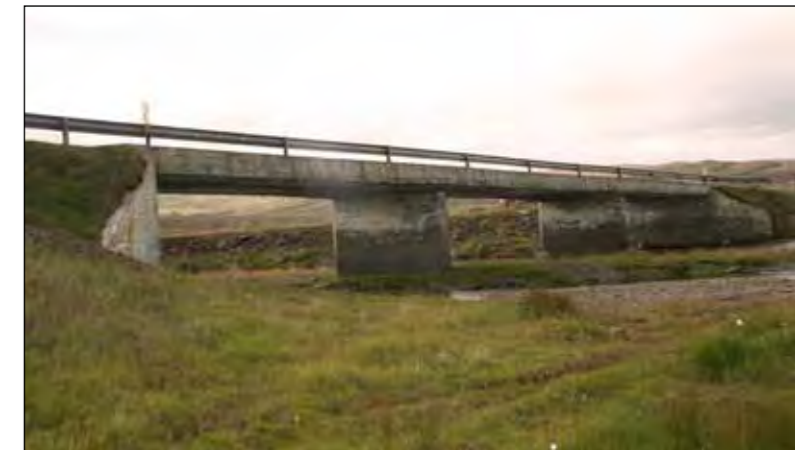
Hrófá á Innstrandavegi (68).

Skila skal tilboðum á sama stað fyrir kl. 14:00 þriðjudaginn 17. maí 2011 og verða þau opnuð þar kl. 14:15 þann dag.