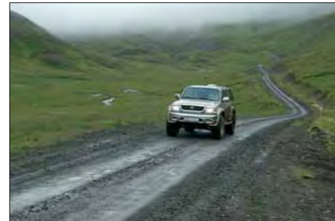
Ingjaldssandsvegur (624), héraðsvegur.