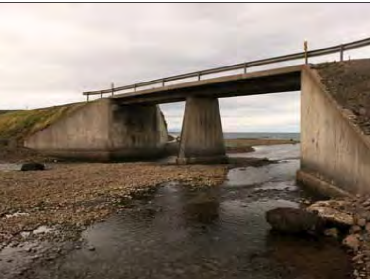
Þambá á Innstrandavegi (68).

Skila skal tilboðum á sama stað fyrir kl. 14:00 þriðjudaginn 17. maí 2011 og verða þau opnuð þar kl. 14:15 þann dag.