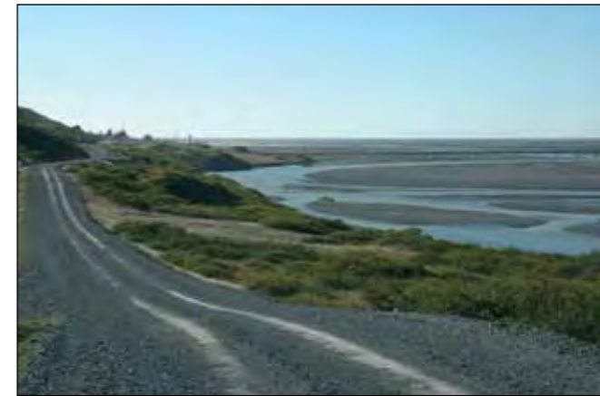
Vegur að Grænuhlíð í Lóni, héraðsvegur.

Landsvegir eru vegir yfir fjöll og heiðar sem ekki tilheyra neinum af framangreindum vegflokkum og aflagðir byggðavegir á eyðilendum. Á vegum þessum skal yfirleitt einungis gera ráð fyrir árstíðabundinni umferð og minna eftirliti og minni þjónustu en á öðrum þjóðvegum.