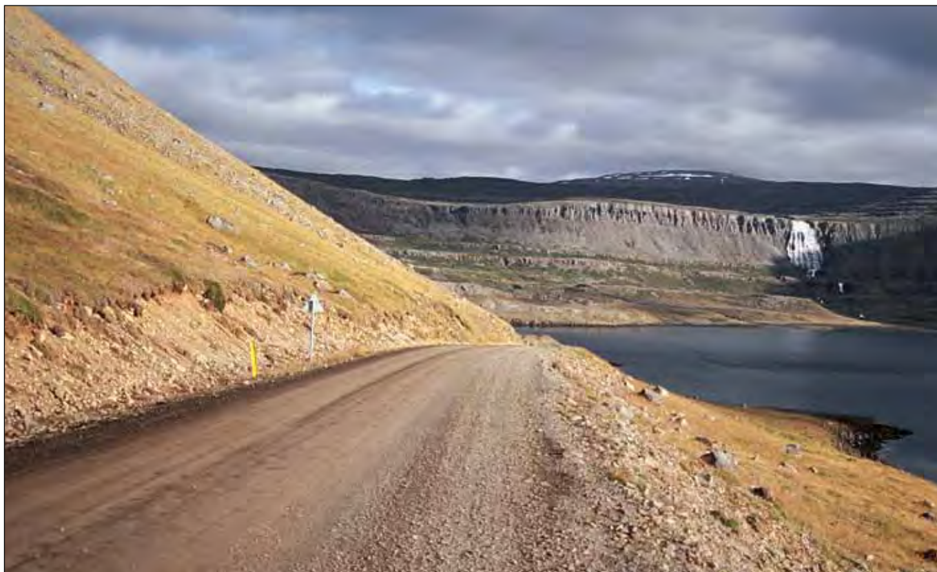
Vestfjarðavegur (60) í Dynjandisvogi, stofnvegur