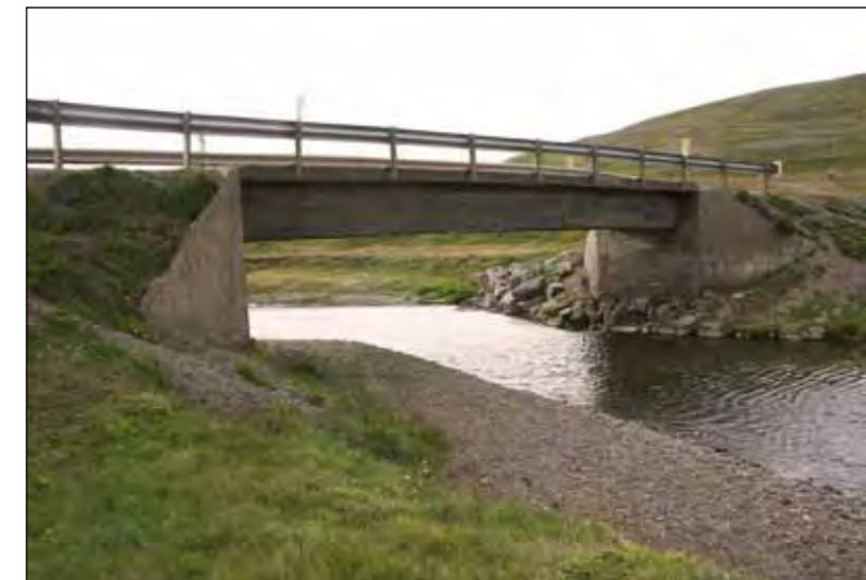
Fellsá á Innstrandavegi (68).

Skila skal tilboðum á sama stað fyrir kl. 14:00 þriðjudaginn 17. maí 2011 og verða þau opnuð þar kl. 14:15 þann dag.