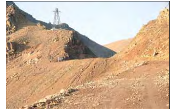
Skarðsvegur (793) Siglufjarðarskarð, landsvegur.