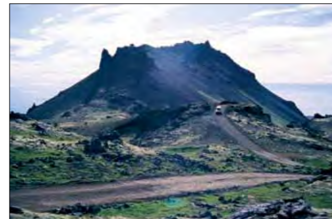
Jökulhálsleið (570), landsvegur.