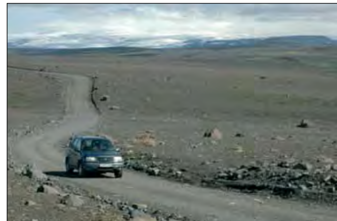
Kjalvegur (35), stofnvegur um hátendi.