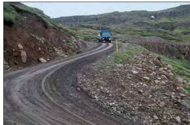
Mjóafjarðarvegur (953), tengivegur.