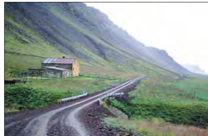
Klofningsvegur (590), tengivegur.