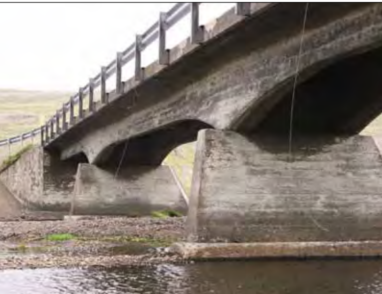
Tunguá á Innstrandavegi (68).