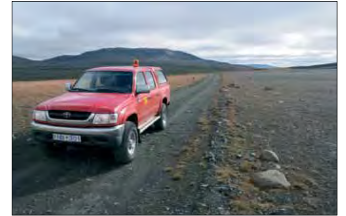
Brúarvegur (907), landsvegur.