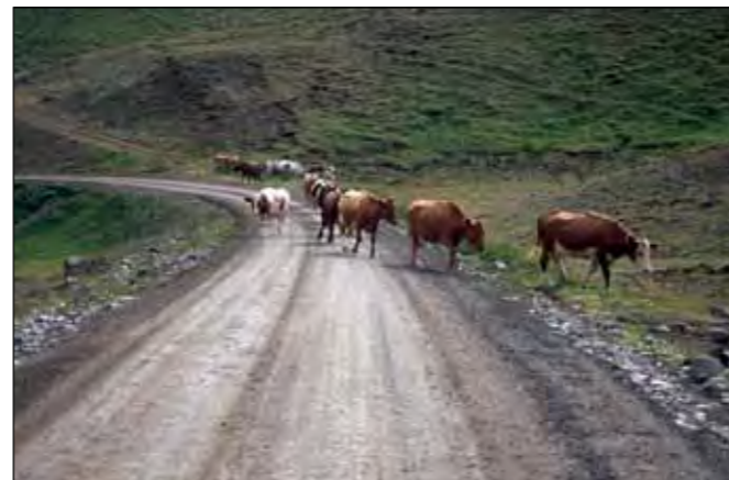
Eyjafjarðarbraut vestri (821), tengivegur.