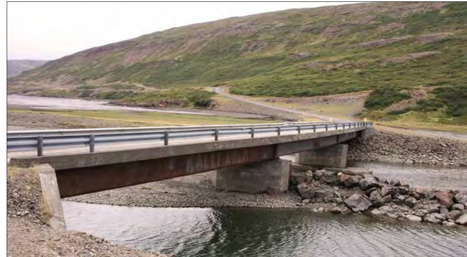
Þorskafjarðará á Vestfjarðavegi (60).

Skila skal tilboðum á sama stað fyrir kl. 14:00 þriðjudaginn 17. maí 2011 og verða þau opnuð þar kl. 14:15 þann dag.