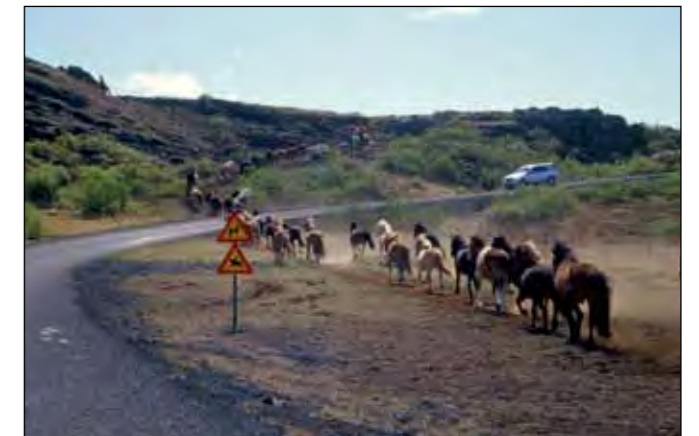
Reiðvegur við Kaldadalssveg (550) hjá Bolabás.